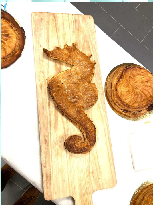
Superbe galette « Spéciale A S R

Avec ces galettes, il était normal de les accompagner avec un produit local (faible en bilan carbone), je veux parler du jus de pomme et de l'excellent cidre. Bien que délicieuses, il en est resté. Je pense que certains sont repartis avec quelques parts supplémentaires de galettes pour continuer la dégustation à domicile.