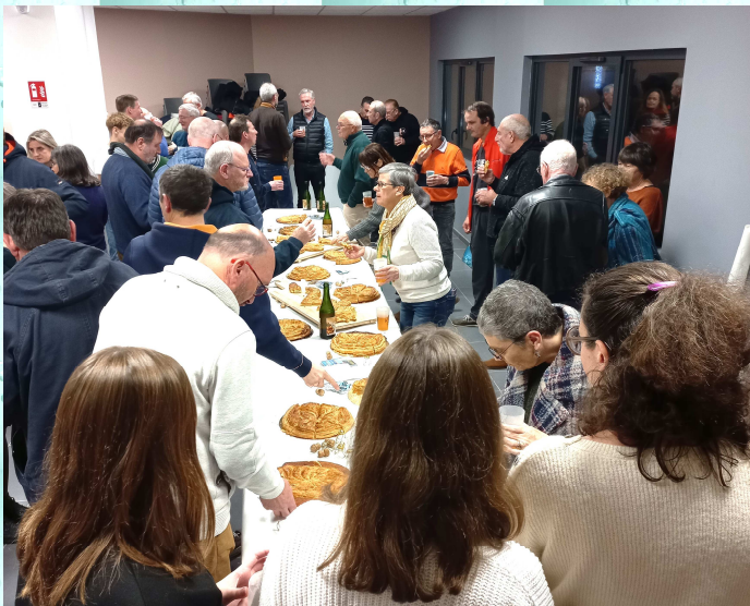
Plus de 40 personnes à la galette